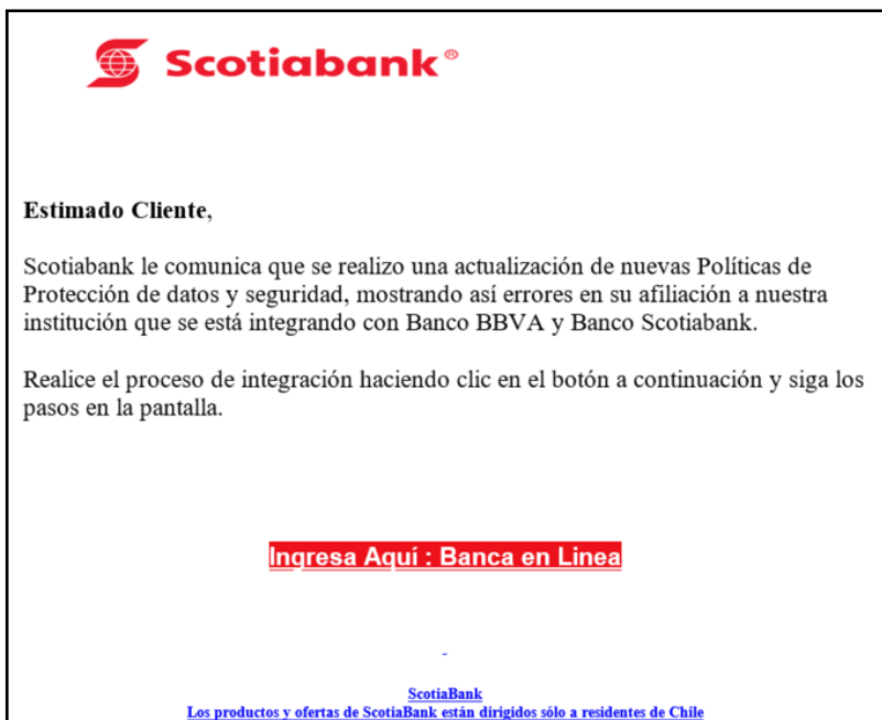
Imagen del correo