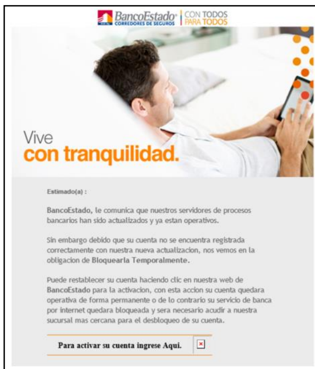
Imagen Phishing Correo