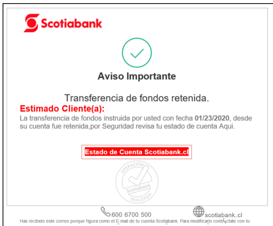
Imagen Phishing Correo

Banco Scotiabank web | Transferencia Retenida ID #