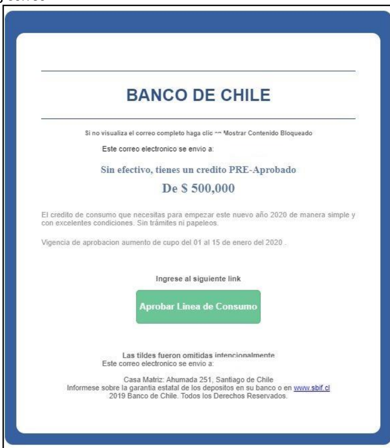
Imagen Phishing Correo

No te quedes sin efectivo Credito aprobado de $ 500,000