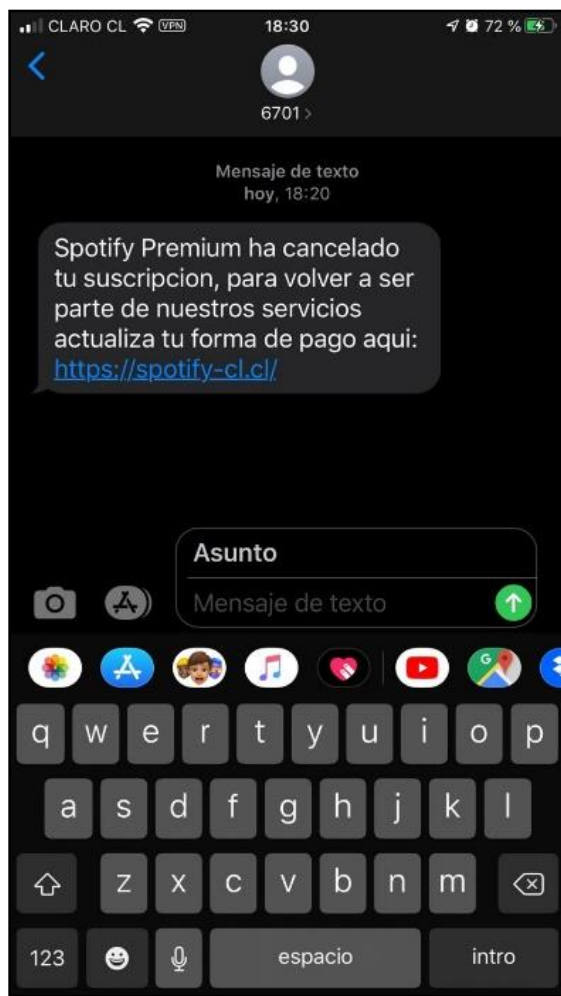
Imagen vía mensajería