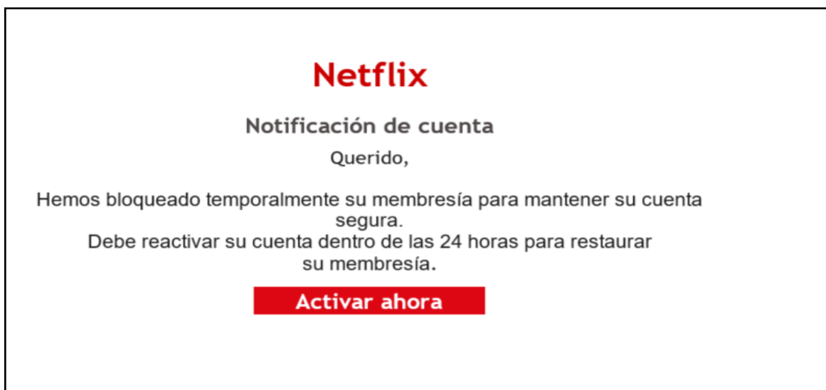
Imagen Phishing Correo