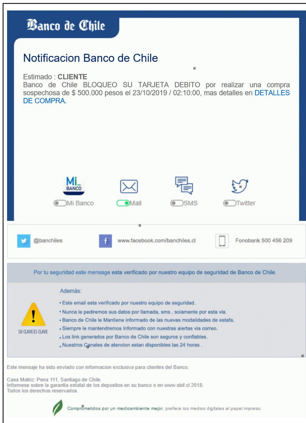
Imagen Phishing Correo