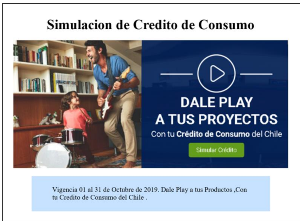
Imagen Phishing Correo