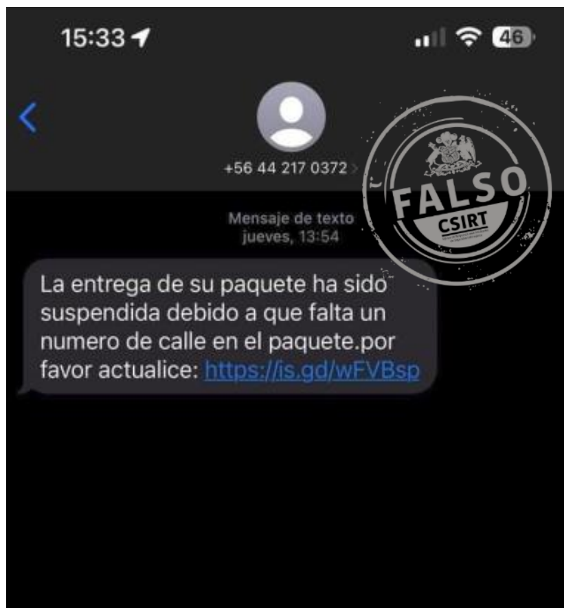
Imagen del mensaje

Equipo de Respuesta ante Incidentes de Seguridad Informática | CSIRT de Gobierno Coordinación Nacional de Ciberseguridad Ministerio del Interior y Seguridad Pública Gobierno de Chile