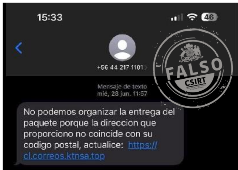
Imagen del mensaje

Equipo de Respuesta ante Incidentes de Seguridad Informática | CSIRT de Gobierno Ministerio del Interior y Seguridad Pública Gobierno de Chile