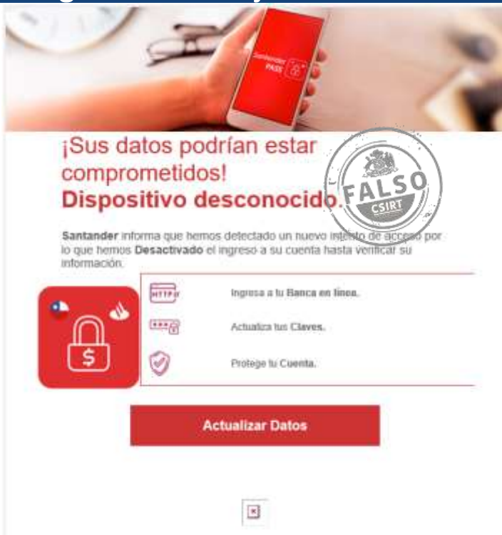
Imagen del mensaje