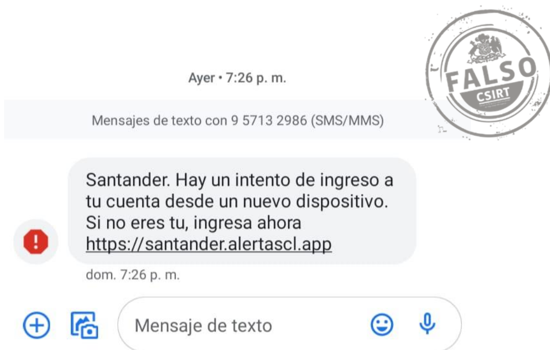
Imagen del mensaje