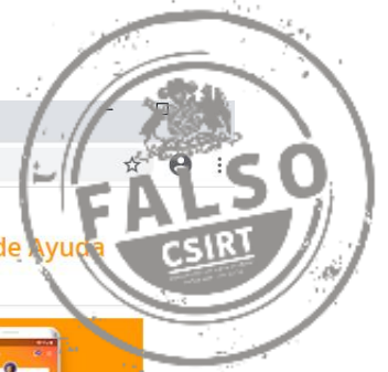
Imagen del sitio