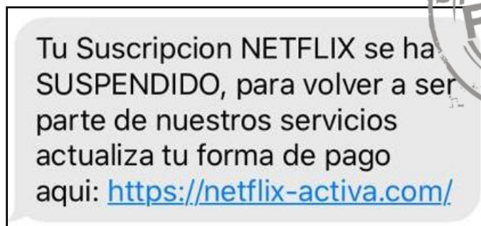
Imagen del mensaje